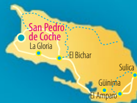
Isla de Coche